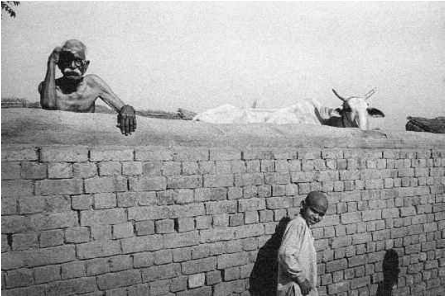
Miroslav Hucek: Vesnice u Agry (Indie), 1970.