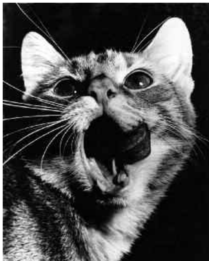
Emil Pardubský: Mňau, 1965. Čestné uznání World Press Photo.