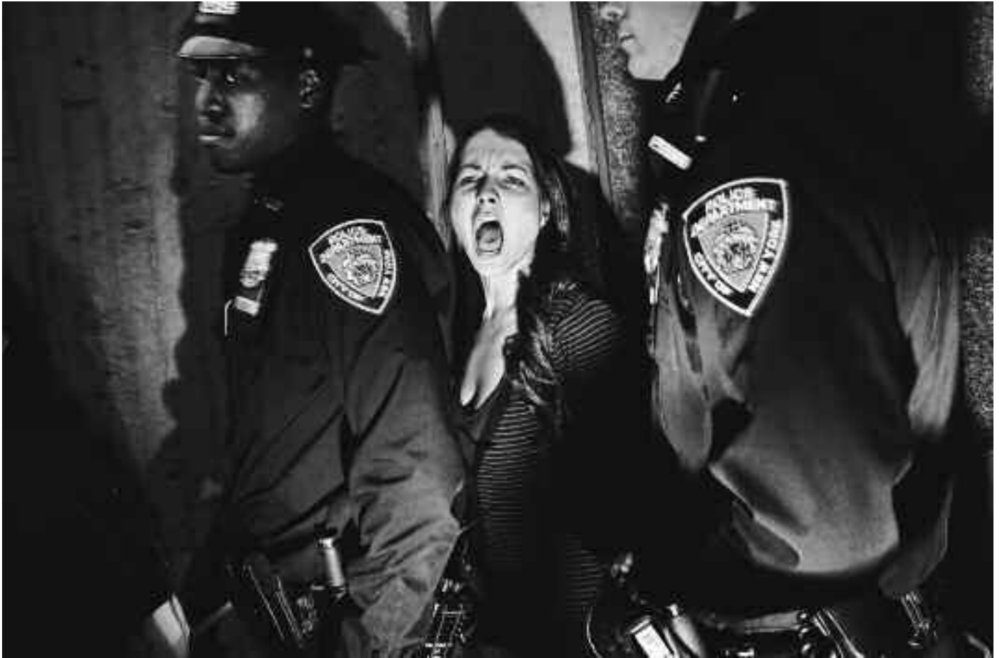
Tomasz Lazar, Polsko: 2. cena Lidé a události/Jednotlivá fotografie.

21. října je v newyorském Harlemu zatčen demonstrant účastnící se protestů proti policejní taktice zvané „zastavit a prohledat“. Je to akce newyorského policejního oddělení, při níž jsou na ulici zadrženi a někdy i prohledáváni lidé, o nichž není jisté, že spáchali nějaký zločin. Policie a úřad starosty tvrdí, že díky této praxi se výrazně snížila kriminalita ve městě. Odpůrci prohlašují, že tato policejní akce diskriminuje skupiny obyvatelstva s nízkými příjmy a lidi jiné barvy pleti. Říjnové demonstrace proti akci „zastavit a prohledat“ přilákaly pozornost hnutí Okupace Wall Street, jehož účastníci protestovali v centru Manhattanu.