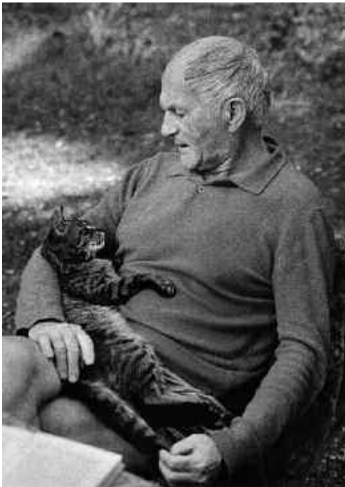
Vojtěch Písařík: Bohumil Hrabal, 1984.