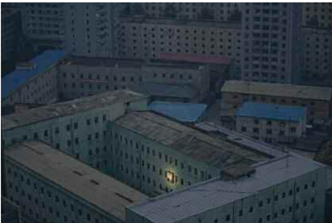
Damir Sagolj, Bosna a Hercegovina, Reuters: 1. cena Každodenní život Jednotlivá fotografie Portrét zakladatele Severní Koreje Kim Il-sunga zdobí budovu v hlavním městě země.

Damir Sagolj se narodil 3. května 1971 v Sarajevu v tehdejší Jugoslávii (nyní Bosna a Hercegovina). V roce 1995 začal pracovat pro Sipu, tiskovou agenturu se sídlem v Paříži. V roce 1997 zahájil spolupráci s agenturou Reuters jako hlavní fotograf pro Bosnu. Jeho prvním zahraničním úkolem pro Reuters bylo zdokumentovat historické události odehrávající se v jeho zemi a na celém Balkáně. Když se později konflikty v této oblasti zmírnily, cestoval po Středním východě a navštívil například Írán, Libanon a Izrael. Jeho snímky invaze koaličních jednotek do Iráku získaly mnoho ocenění, mimo jiné se dostaly i do finále Pulitzerovy ceny. Jeho fotografie publikovaly přední světové časopisy a noviny, jako například Time, Newsweek, Spiegel, Stern, New York Times, Life, Washington Post a Le Monde.