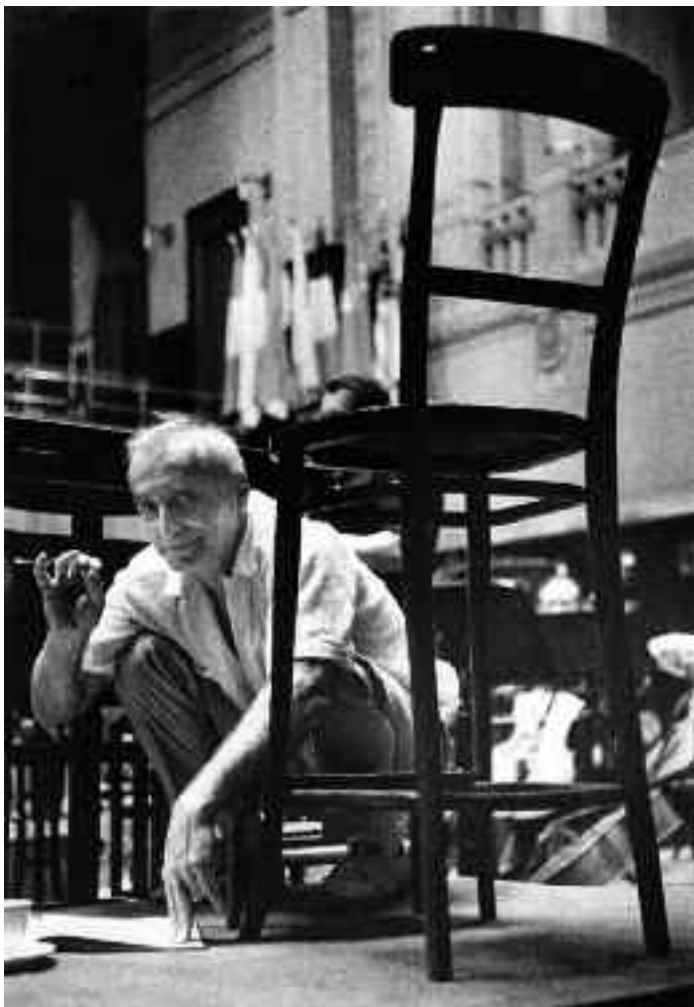
Národní umělec Václav Neumann, 1979.