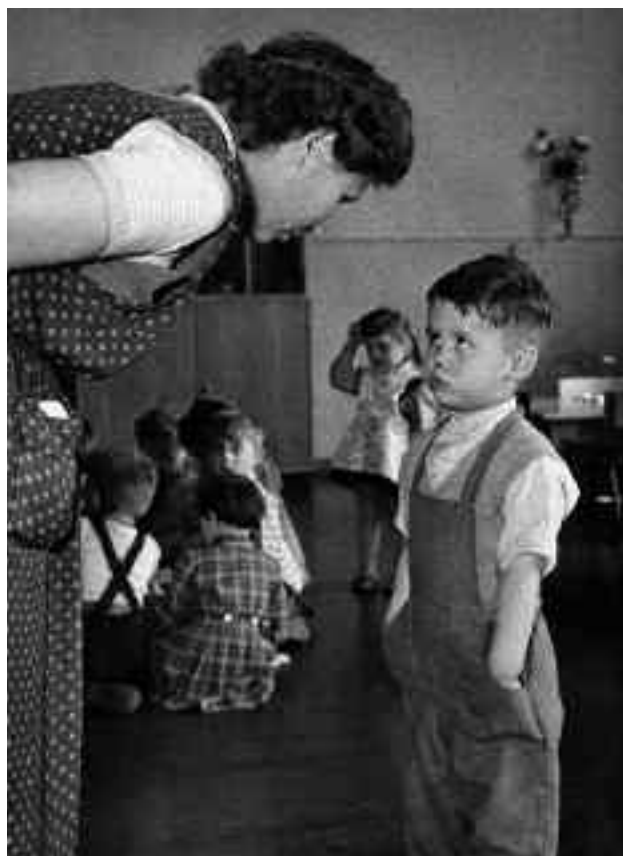
Vilém Kropp: Provinilec, 1959. 1. cena World Press Photo.