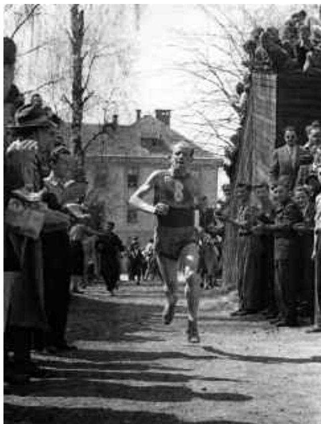
Emil Zátopek, 1952.