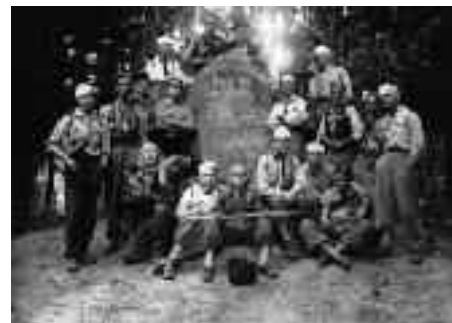
Jedna z předválečných fotografií českobudějovických trampů z výstavy v Jihočeském muzeu v Českých Budějovicích Po stopách jihočeského trampingu.

Třebaže byl trampingu předchozími režimy odsuzován a prezekvován a ani širší veřejnost mu nebyla vždy příznivě nakloněna, je neopominutelnou subkulturou, která zákonitě patří do české historie. Proto je třeba uchovat jeho odkaz i pro příští generace. Také proto tedy trampský svět s povděkem kvituje vstřícnost Jihočeského muzea k této problematice. Dlužno dodat, že i v Národním muzeu v Praze vzniká něco podobného, ovšem v celostátním měřítku. Je ovšem pochopitelné, že regionální aktivita v tomto směru vytváří pro Jihočechy daleko širší