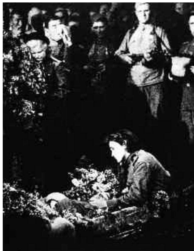
Tibor Honty: Padl v posledních dnech války (známá také pod názvem Pohřeb rudoarmějce), 1945.