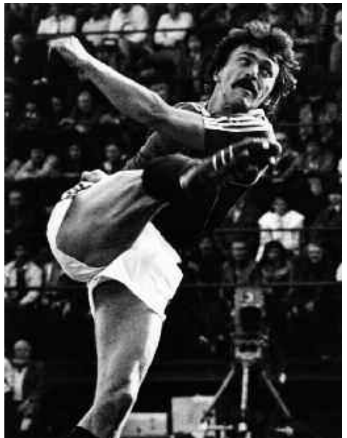
Břetislav Kostka: Tvrdá pravá, nedatováno.