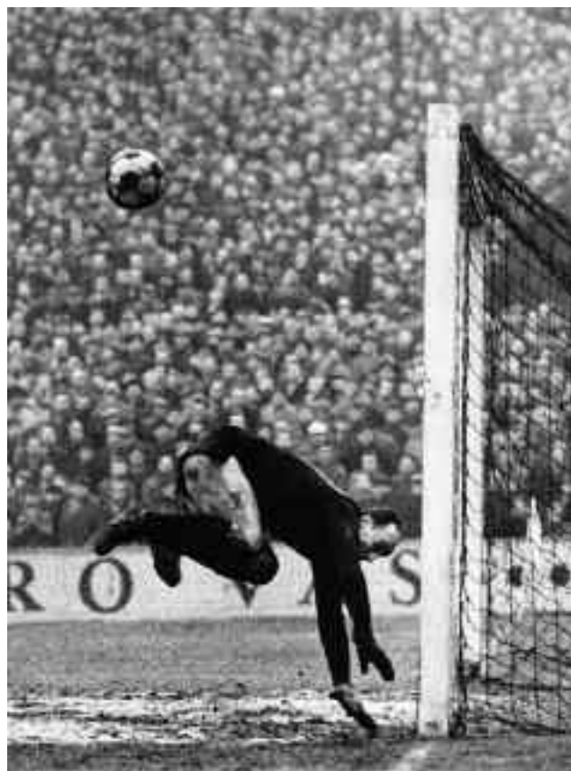
Emil Fafek: Schroifova specialita, 1964.