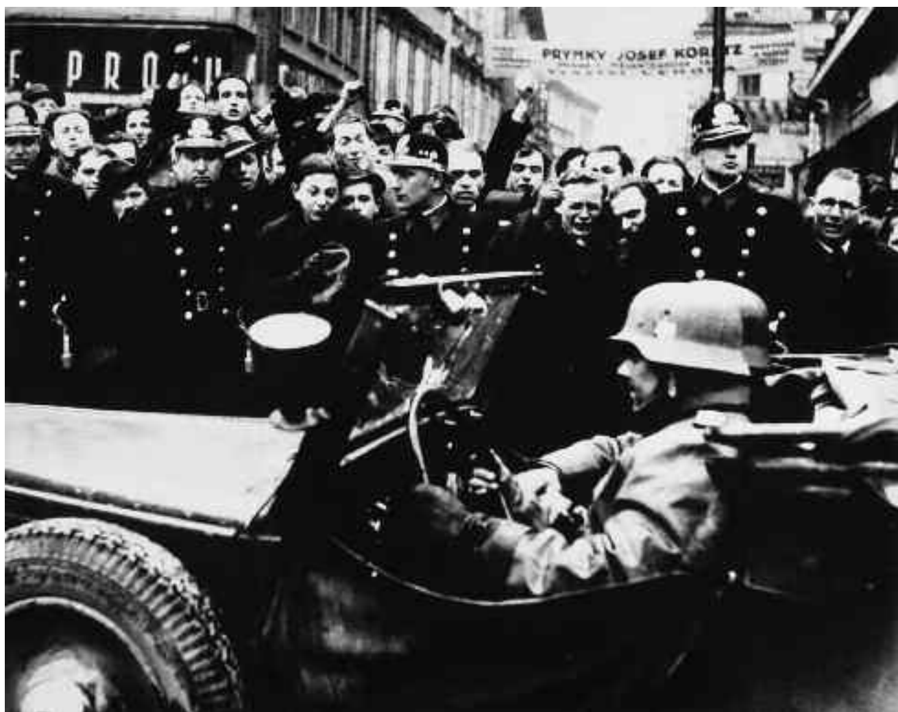
Josef Novák: Fašističtí okupanti obsazují Prahu, 1939.