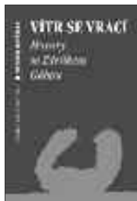
Vítr se vrací