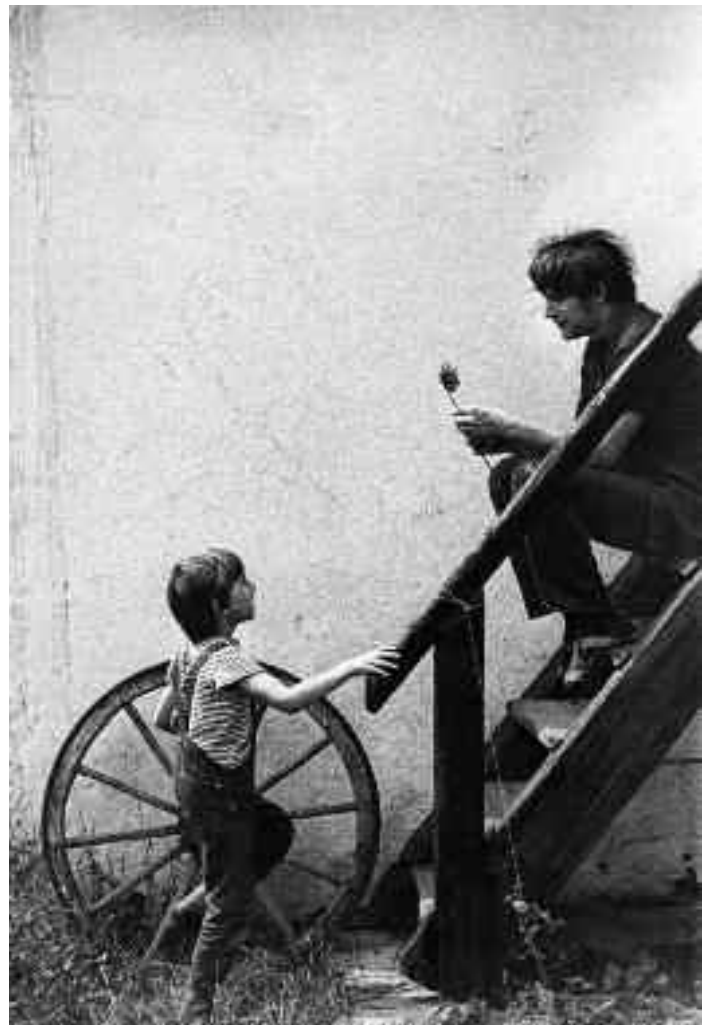
Jiří Suchý se synem, nedatováno.