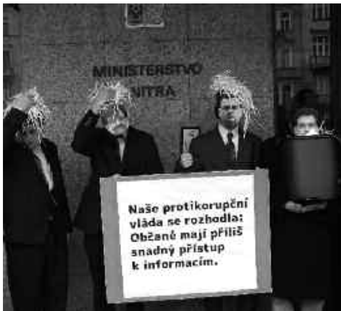
„Naše protikorupční vláda se rozhodla, že občané mají příliš snadný přístup k informacím.“ Z hepeningu, který uspořádalo 9. listopadu 2012 Pražské fórum před budovou Ministerstva vnitra ČR.

vé „patro“ procesu. Také se navrhuje, aby záloha propadla i v případě, kdy žadatel, dozvědív se požadovanou celkovou částku, od žádosti ustoupí, a to i tehdy, kdy úřad ještě nic neudělal. Navrhuje si i věcné rozšíření toho, za co bychom měli platit, a to pomocí nenápadného a v důvodové zprávě zamlčeného přidání dvou slůvek. Napříště bychom již neplatili jen za vyhledání, ale za cokoli, o čem úřad usoudí, že s vyhledáváním souvisí. V některých případech se již podáním žádosti dostanete do situace, kdy určitě něco zaplatíte, ale nevíte, kolik. A může to být dost. Lepší způsob jak odradit každého žadatele snad ani nelze vymyslet.