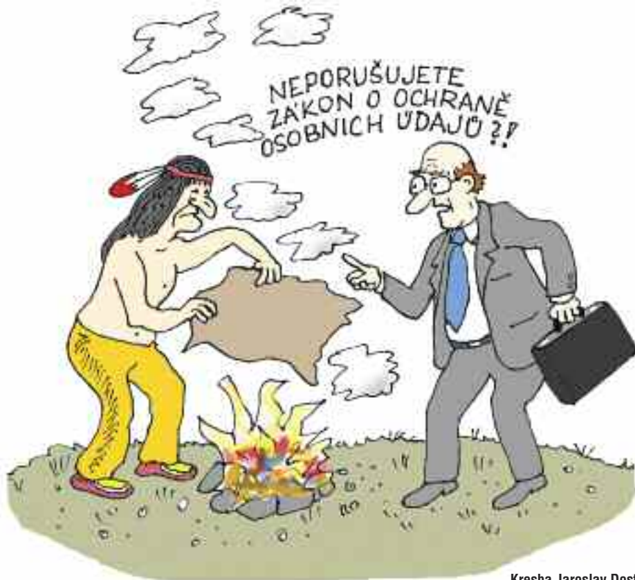
Kresba Jaroslav Dostál