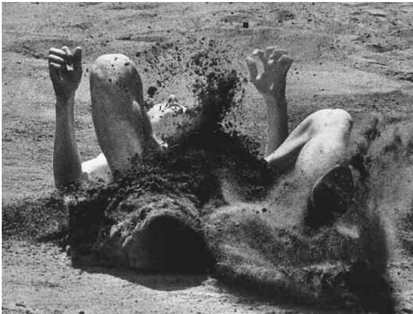
Poslední pokus, 1975 (1. cena World Press Photo v kategorii Sport)