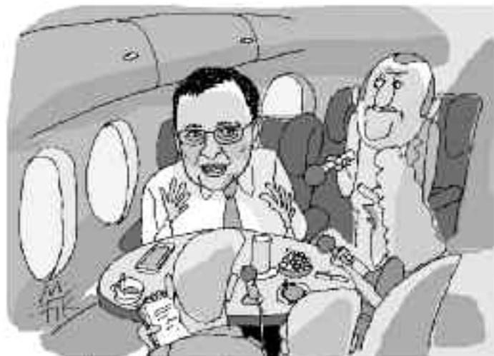
OBAMA BYL PRÁTELSKY AŽ DO OKVIL? NEŽ JSAM MU OZNÁMIL, ŽE VÝBĚR MŮJMA NA DOSTAVBU TENISOVNA BUDE PROCHÁZET TYPOUKY ČESKOU TRANSPARENTNÍ ČESTOU.