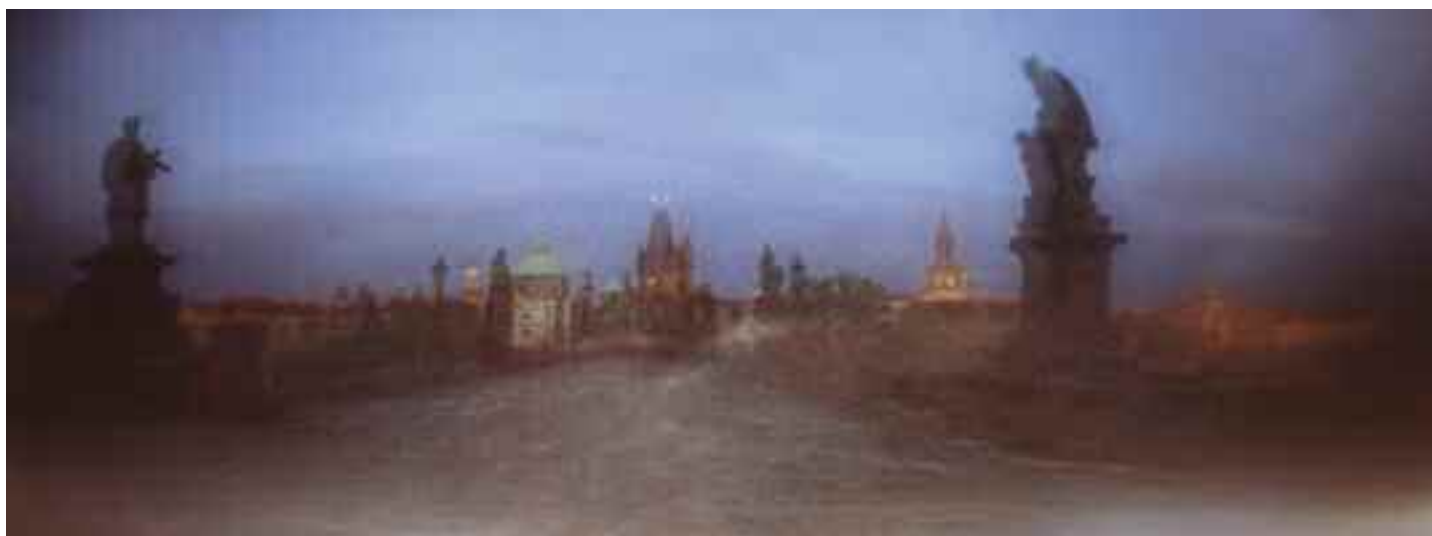
Karlův most (Z cyklu Pražské veduty dírkovou komorou, 1992–2000)