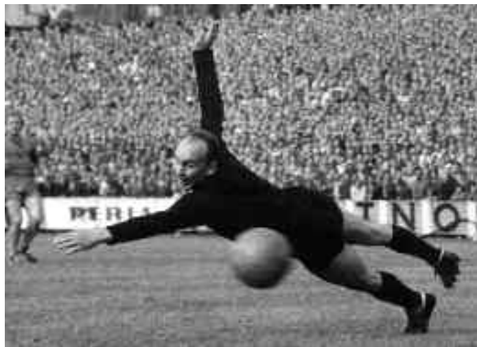
To se může stát i tomu nejlepšímu, Chile 1963 (čestné uznání WPP)