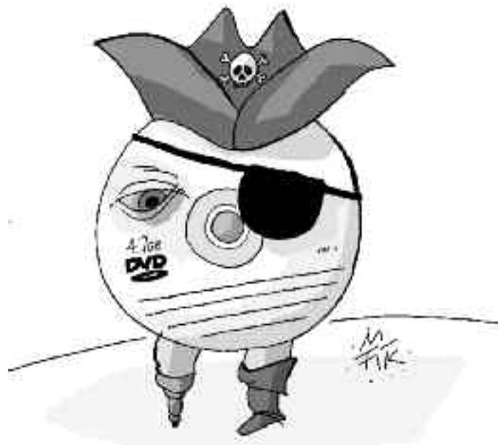
Kresba Miroslav Fojtík