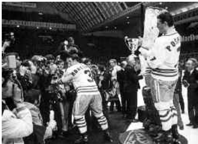
Obránce, 1973 (1. cena v soutěži 100 nejlepších sportovních fotografií)