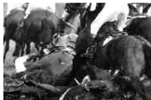
Z cyklu Koně a pěšáci, 1975 (1. cena v soutěži 100 nejlepších sportovních fotografií)