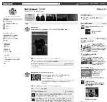
Nová rodina na první procházce v parku u svého sídla. Fotil bratr Victorie, princ Carl Philip a fotografie uveřejnili na Facebooku.

Jaký má monarchie praktický význam v běžném, všedním životě Švédska? Právě že žádný. Král je sice oficiální hlavou státu, ale do politiky se vměšovat nemůže, a jakmile se o čemkoliv vyjádří, ozvou se okamžitě razantní protesty. Královská rodina má dnes význam