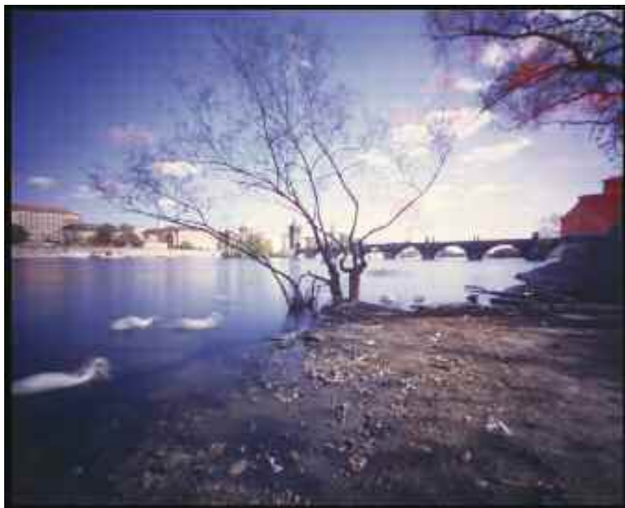
Z cyklu Pražské veduty dírkovou komorou, 1992–2000