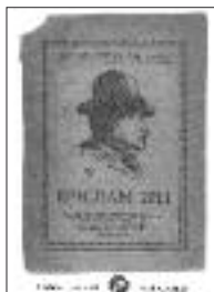
Epigram 2011 © interes.cz pro Územní sdružení SN Vysočina, 2011

Uplynulý rok Karla Havlíčka (narozen 1821, zemřel 1856) připomíná sborník epigramů – výběr z autorské soutěže, kterou připravilo Územní sdružení Syndikátu novinářů Vysočina.