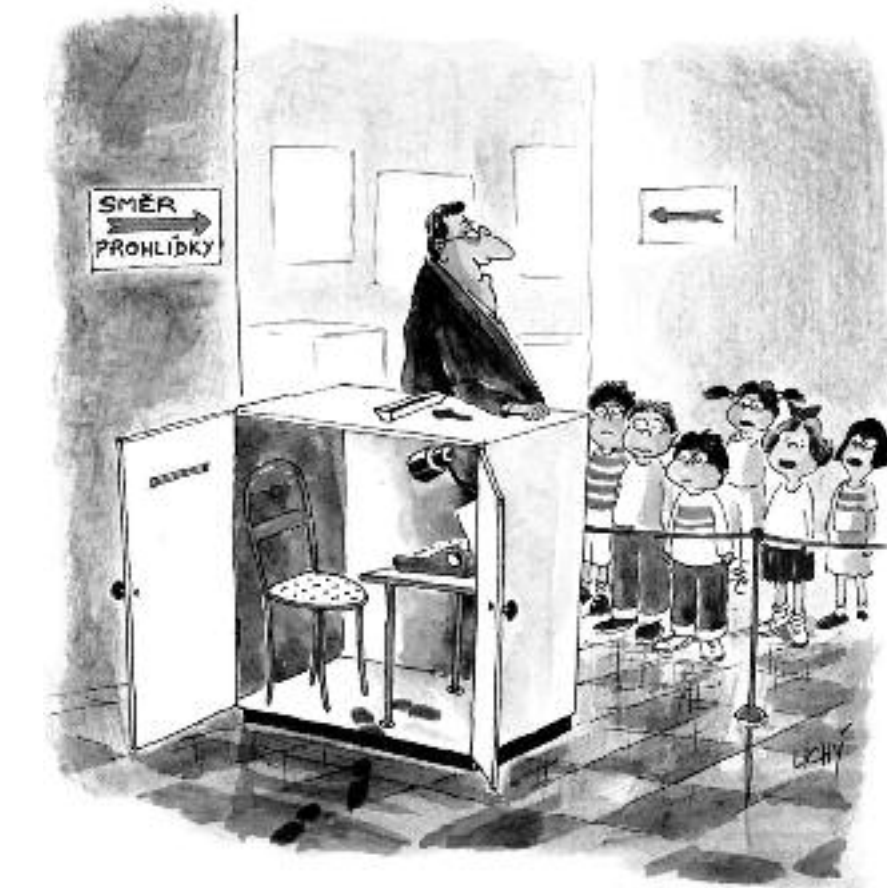
A TOHLE JE NAŠE PRVNÍ KOPÍRKA, DĚTI.

Zato pro začínající filmaře bez kontaktů jsou nová média požehnáním. Znalec virtuálního prostředí dokáže za minimální prostředky vyprodukovat a rozšířit krátkometrážní doku-