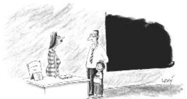
NESHYSL, PANÍ UČITELKO. O SEXU SE VŠECHNO DOZVÍ NA INTERNETU!