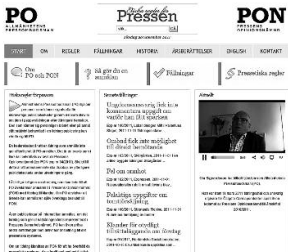
Domovská internetová stránka Pressens Opinionsnämndu, Allmänhetens Pressombudsman (PO).

Autorka v roce 1981 absolvovala specializaci Televizní a filmová žurnalistika na Fakultě žurnalistiky Univerzity Karlovy. Od roku 1982 žije trvale ve Švédsku a od roku 1986 pracuje jako žurnalistka ve švédských odborných časopisech a magazínech. Od roku 2001 je zaměstnaná v technickoprůmyslovém magazínu Automatizace, kde vede zpravodajskou sekci.