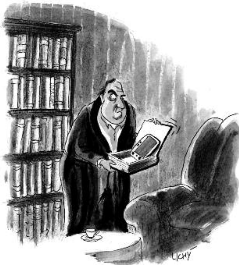
Kresba Lubomír Lichý