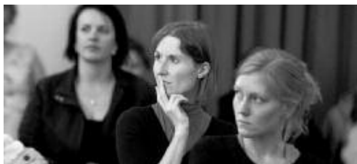
Z konference Česká novinářka – K postavení a obrazu novinářek v českých médiích v pražském Goethe Institutu 29. září 2011.