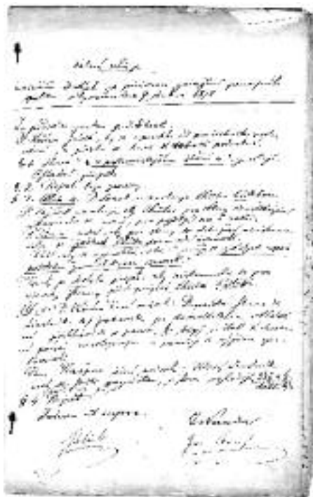
Zápis ze schůze českých novinářů k ustavení penzijního spolku dne 9. 4. 1872, signován Janem Nerudou.