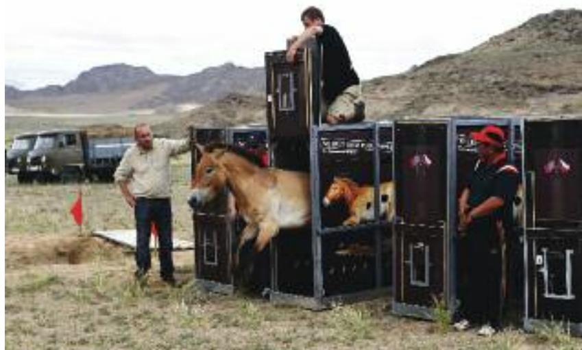
Návrat koní z pražské zoo zpět do volné přírody, Mongolsko 2011 (série). 3. cena v kategorii Životní prostředí