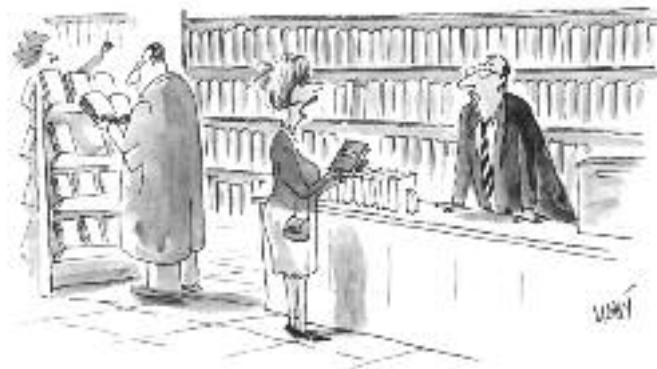
VEZMU SI TUHLE ... KDE TO MÁ ENTER ?