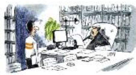
Kresba Lubomír Lichý

Zaplatit můžete také v hotovosti přímo v kanceláři SN ČR. ■