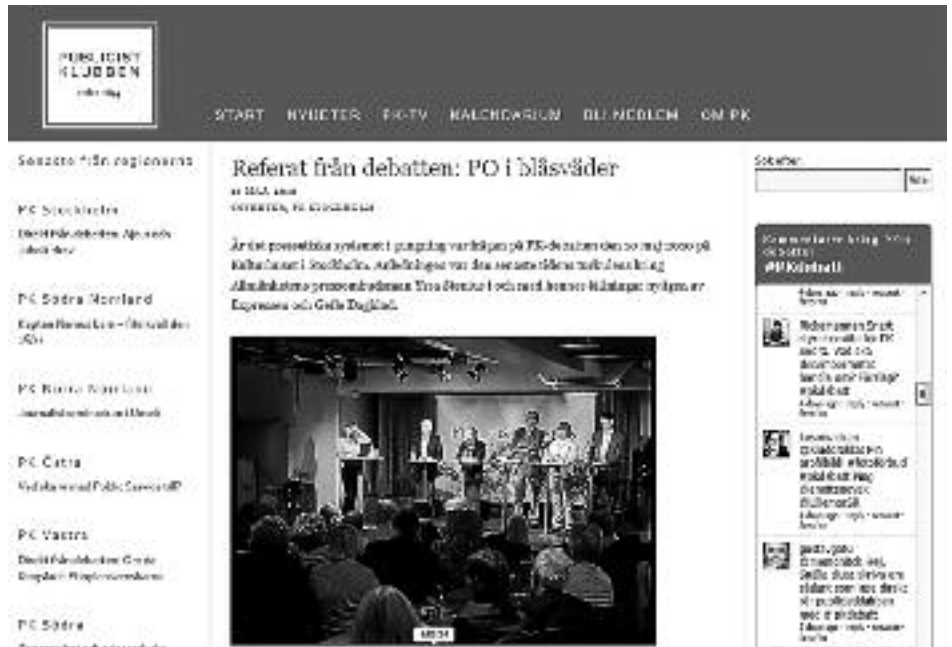
Domovská internetová stránka Pressens Opinionsnämndu, kde byl uveřejněn rozhovor s Allmänhetens Pressombudsmanem (PO)

Veškerá Stiegova žurnalistická etika je shrnuta v Milénium . A také jeho úcta vůči čtenáři. Mikael