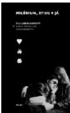
Milénium, Stieg a já Host, 2011