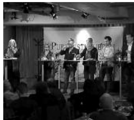
Jedna z mnoha debat Publicistklubben, kde se diskutuje o etice žurnalistiky.

Švédové si velmi zakládají na tom, že tyto výše uvedené instituce tvoří systém pro etiku žurnalistiky, který je dostatečně sebereguluje.