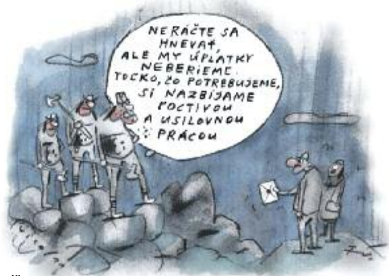
Kresba Fedor Vico