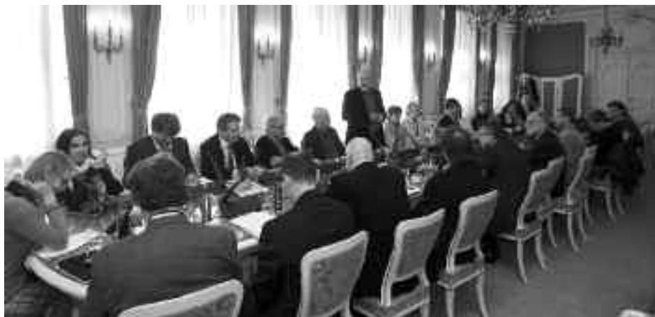
Z jednání česko-britského novinářského kolokvia v Senátu Parlamentu České republiky.

Účast z britské strany lze hodnotit coby vynikající, jak reprezentativností a profesionální úrovní účastníků, tak i vlastními vystoupeními a aktivitou. Je potěšující, že britští účastníci si celou akci pochvalovali a dali najevo zájem o další pokračování.