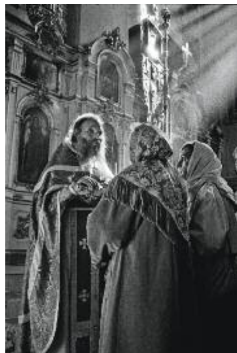
Ruský pravoslavný klášter Pjuchdice, 2000