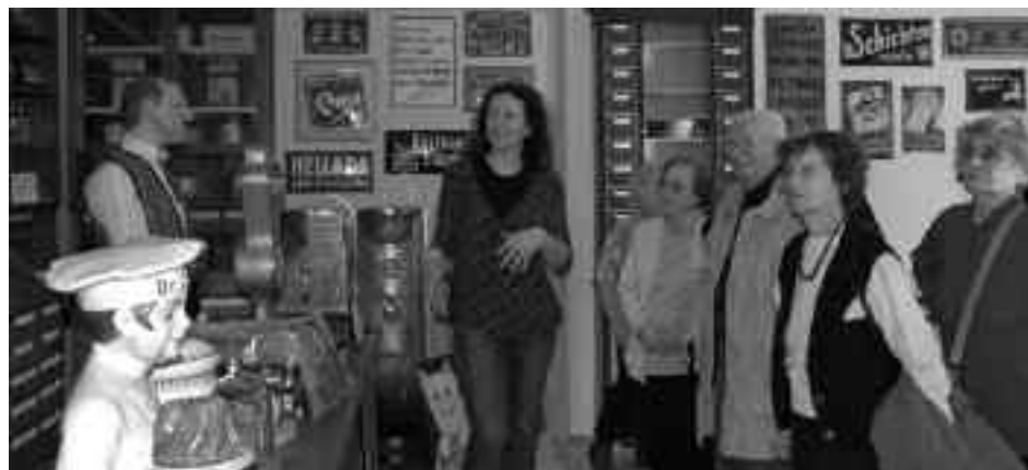
Brněnští novináři-seniorů u Bajzy.

Přítomní kolegové se shodli v tom, že tato organizace pokračuje ve vytyčeném směru, který zahrnuje tři hlavní oblasti: vzdělávání členů, získávání mladých a začínajících novinářů a spolupráce s kolegy ze sousedního Polska, se kterými SN v Ostravě už léta udržuje oboustranné kontakty. Z diskuse dále vyplynulo, že se ostravské sdružení v dalším období také více soustředí na spolupráci s kolegy z Olomouckého kraje. Bude proto mimo jiné pokračovat ve výjezdních jednáních do této části regionu, při kterých se může s tamními členy setkávat osobně a lépe si tak předat podněty a náměty k další činnosti.