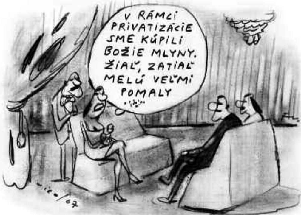
Kresby Fedor Vico

kam musí loterijní společnosti odvádět část zisků, jsou jen zástěrkou pro podnikání loterijních firem, které je samy zřídily. Je možné najít konkrétní důkazy. Hušákova vila dostává tím jaksi jiný rozměr. Výsledkem je slušný přehled, co se děje, ale obyčejně také absence přesvědčivých důkazů.