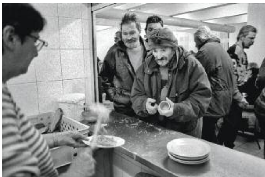
Armáda spásy, Praha, 2007