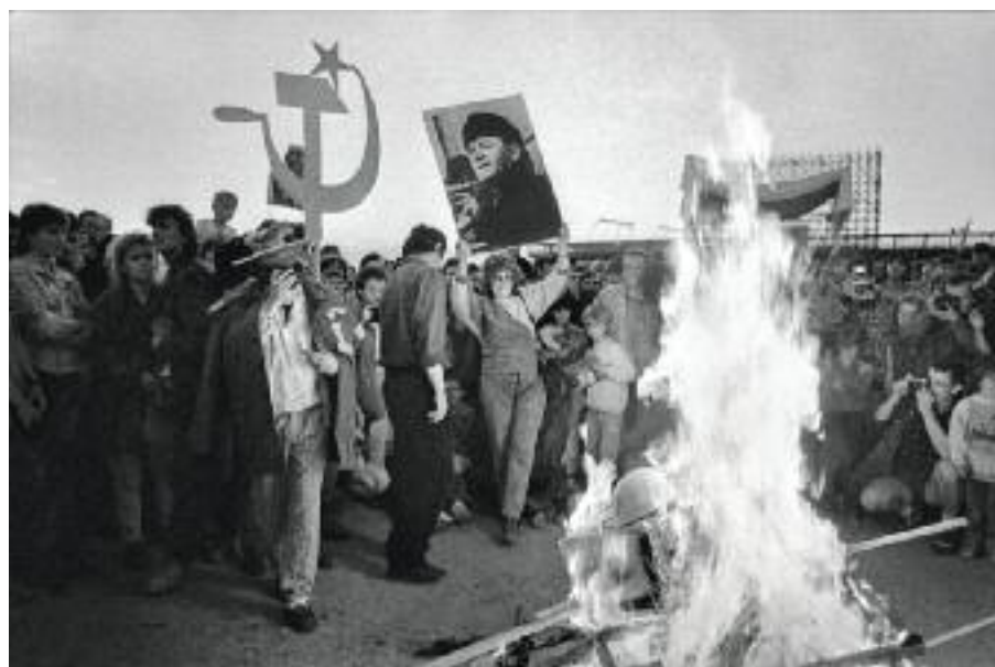
Májáles, Praha, 1990