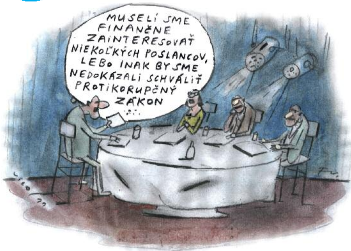
Kresba Fedor Vico