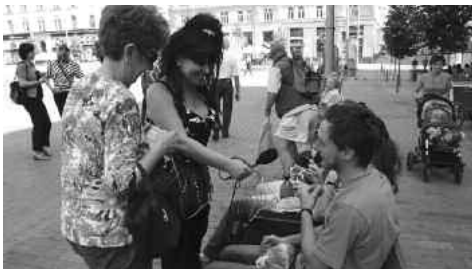
Účastnice projektu volná novinářka v ulicích.