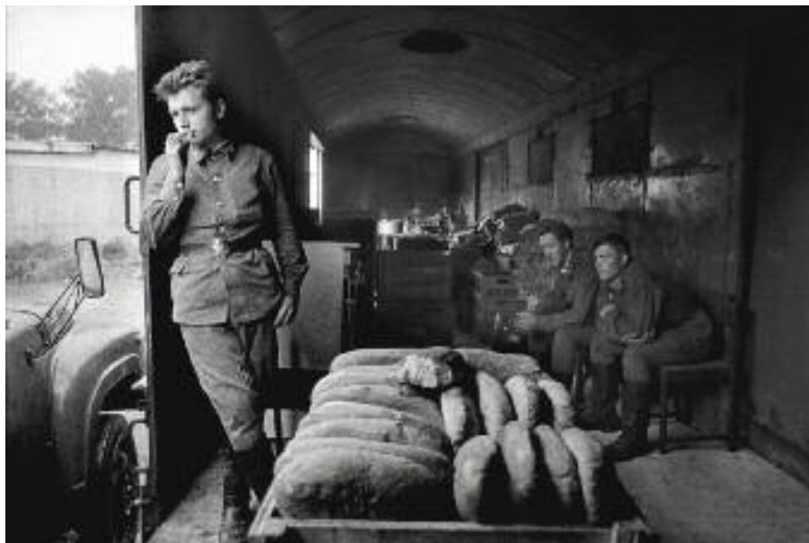
Odchod vojsk, 1990–91