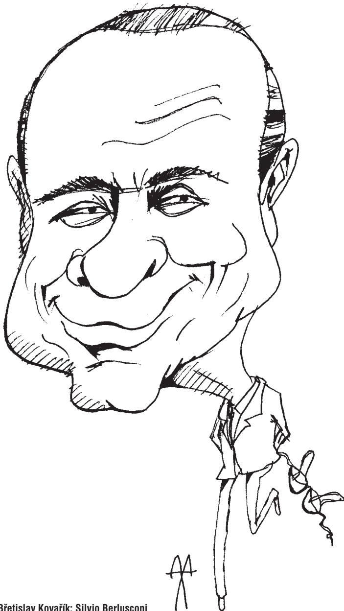
Břetislav Kovařík: Silvio Berlusconi

Ani to ale ještě nemusí být nejhorší varianta. Ta nastane, pokud se blog stane zdrojem nikoli názoru, ale informace - aniž by se dále ověřovala. To je nejklaštější příklad žurnalitky a navíc nechtěné - politik sa-