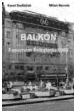
Balkón – fenomén listopadu 1989