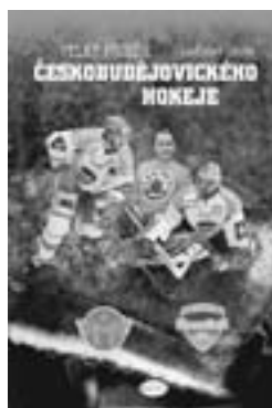
Ladislav Lhota: Velký příběh českobudějovického hokeje