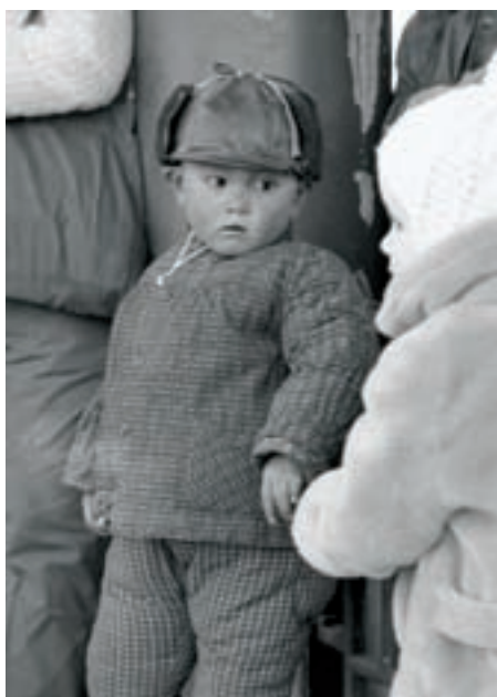
„Vypadá nějak jinak,“ diví se čínský chlapec nad tím z Evropy. Peking (1968)