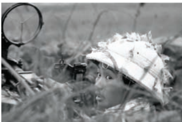
Vietnamská bojovnice (1968)