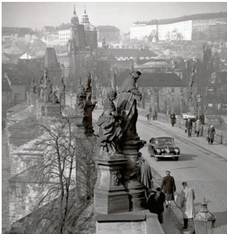
Doba, kdy po Karlově mostě ještě jezdila auta... (60. léta)

K jeho zálibám patří fotografování kulturních událostí a osobností. V ČTK začal pravidelně fotografovat mj. hudební festival Pražské jaro (zachytil průběh 25 ročníků) a jaz-