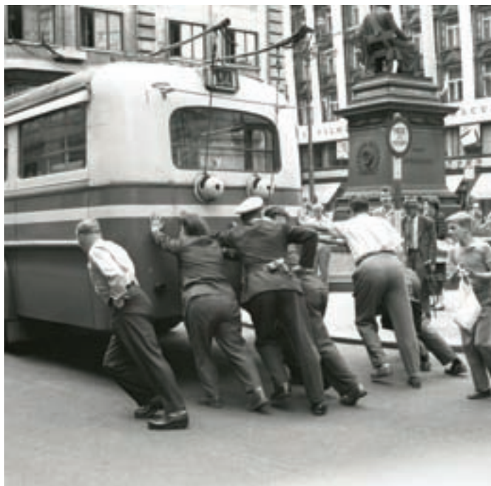
Nepojízdný trolejbus na Jungmannově náměstí v Praze (60. léta)