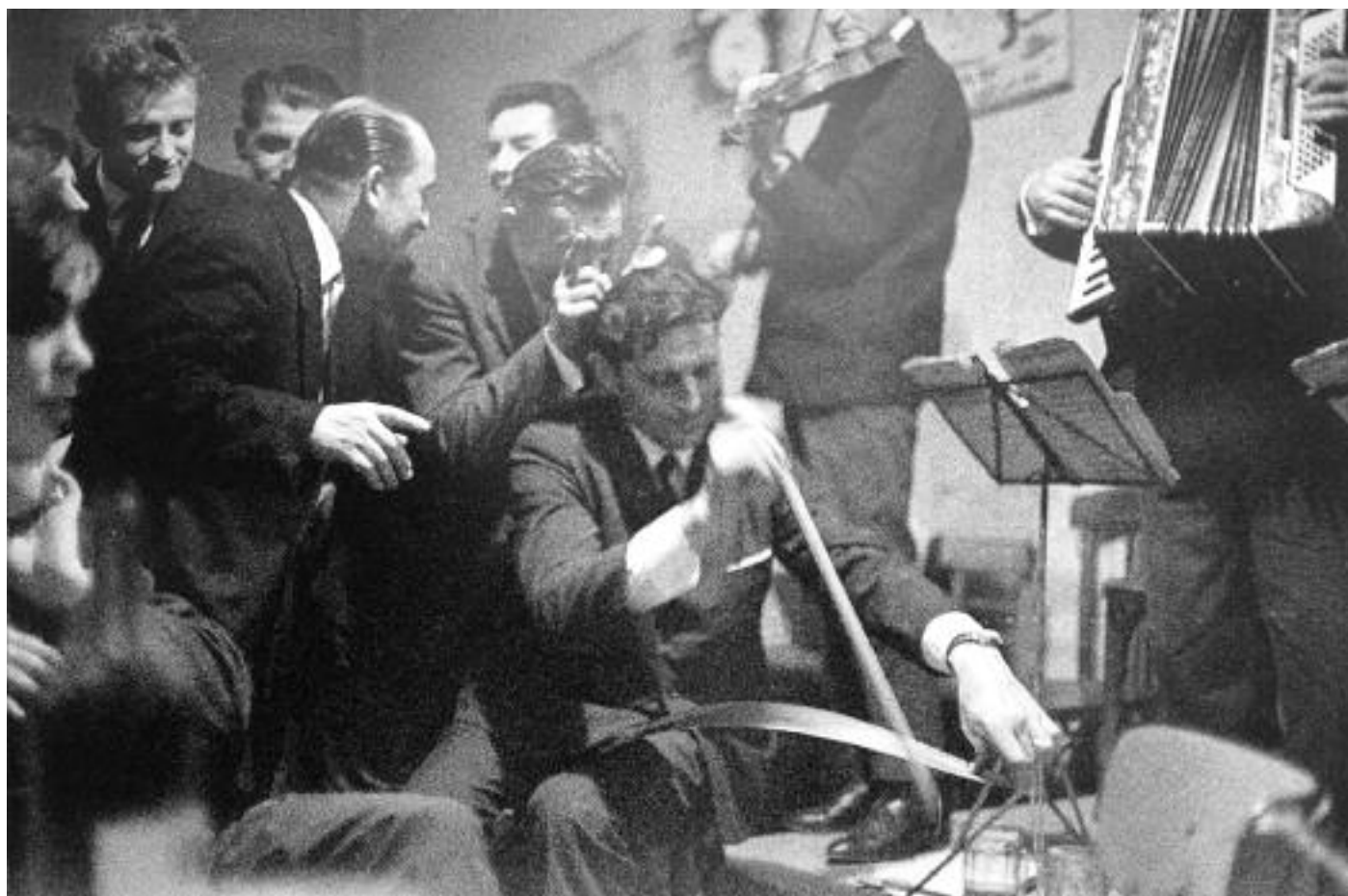
Všechny snímky pocházejí ze souboru autorky s názvem Vesnická tancovačka (1966).