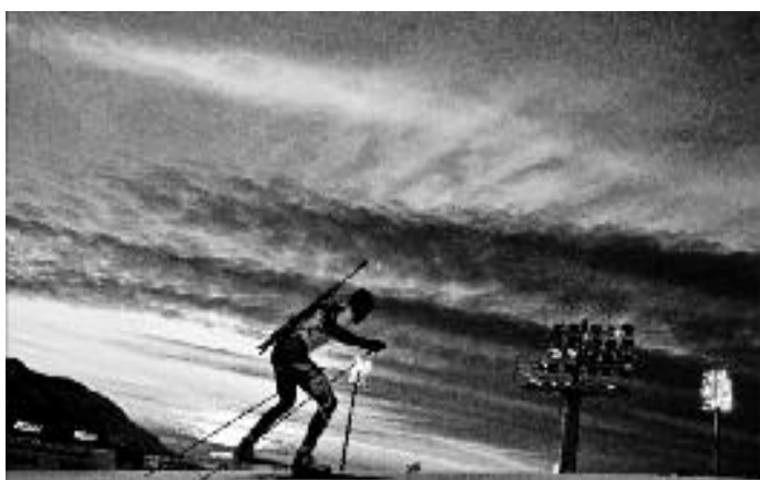
Zimní olympijské hry v Soči, Rusko 2014. První cena v kategorii Sport