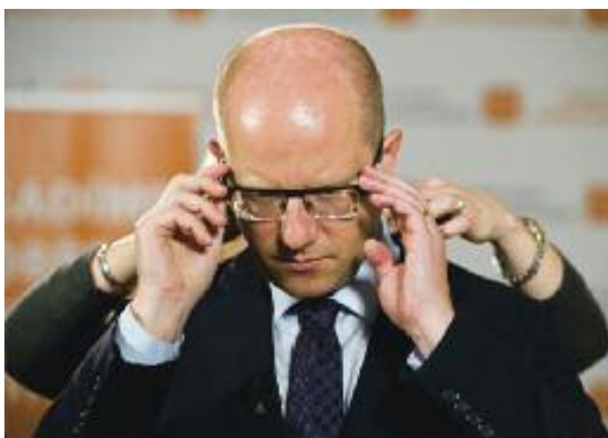
Budoucí premiér Bohuslav Sobotka vítězí v parlamentních volbách, Praha, 2013. Druhá cena v kategorii Lidé, o kterých se mluví