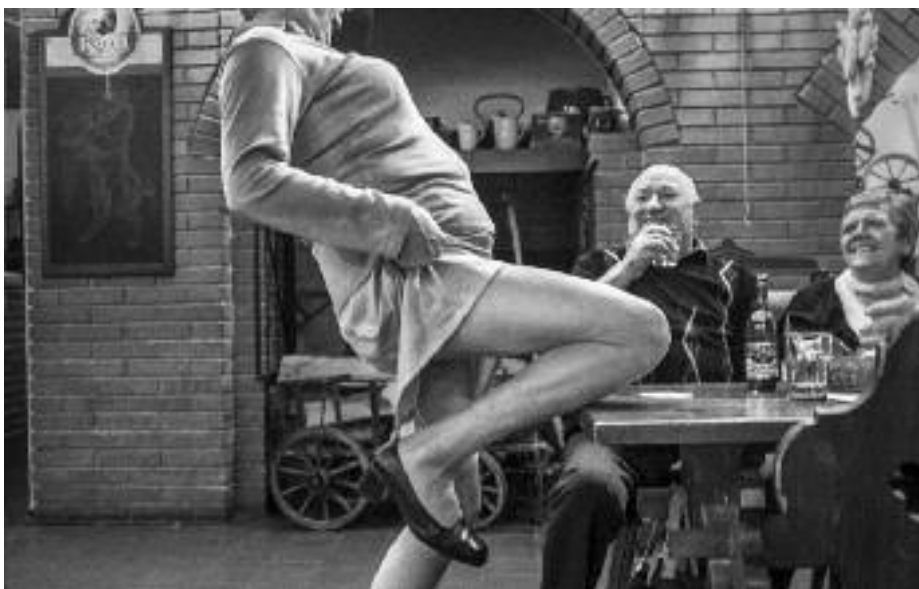
Michael Hanke, volný fotograf: Senioři – taneční zábavy, Česko 2013–2014. První cena v kategorii Umění a zábava