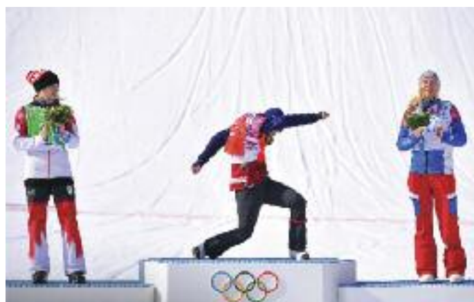
Eva Samková – Zlatá radost, ZOH Soči 2014. Nikon Sport Award 2014