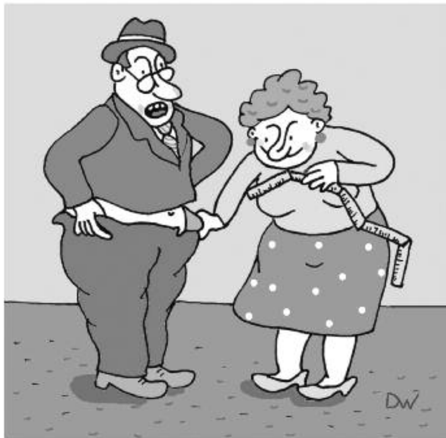
Opravdu má, paní redaktorko, občan právo vědět o svém poslanci vše?