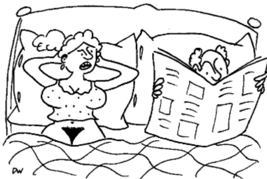
Když jste říkal, že máte rád v posteli černou, nenapadlo mě, že kroniku!

Rovněž zajímavou profesní kariéru má za sebou africký dopisovatel Rageh Omaar , původem ze somálského Mogadiša, který v současné době pracuje pro BBC z Johannesburgu.