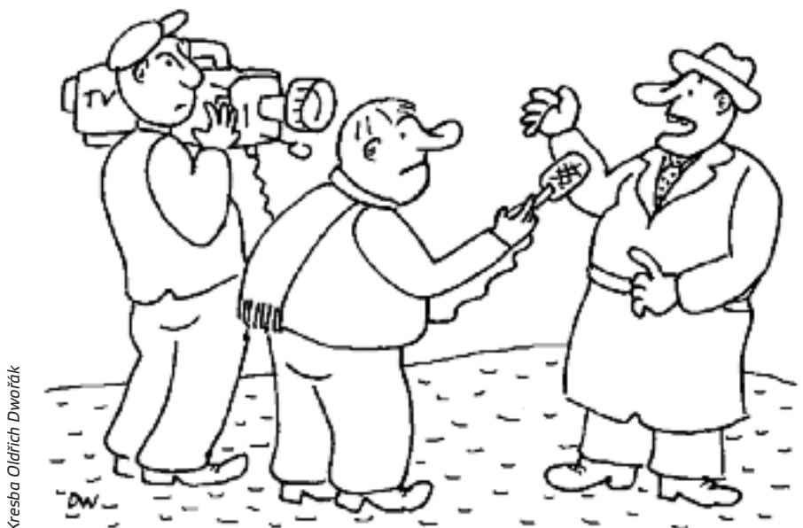
Kresba Oldřich Dvořák

Výše popsaná německá praxe ukazuje, že prostřednictvím odborů lze i v médiích hodně věcí ovlivnit. Paralelně se v České republice začíná reálně diskutovat nad tím, že by se například Syndikát novinářů ČR mohl změnit v odborovou organizaci a začal hájit zájmy zaměstnanců v médiích, především v těch veřejnoprávních.