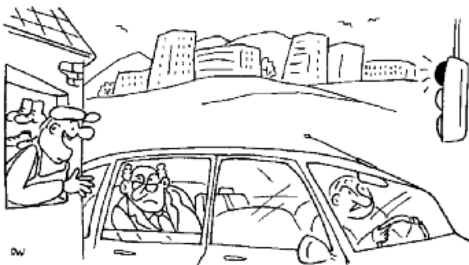
Kresby Oldřich Dvořák

Doménou Christine McGourtyové je věda v nejšířší podobě – od astronomie přes genetiku a paleontologii. Pracuje pro rozhlas, přispívá také do večerních televizních zpráv. Zaměstnání v BBC získala v roce 1995 – po šesti letech práce pro list Daily Telegraph, kde se